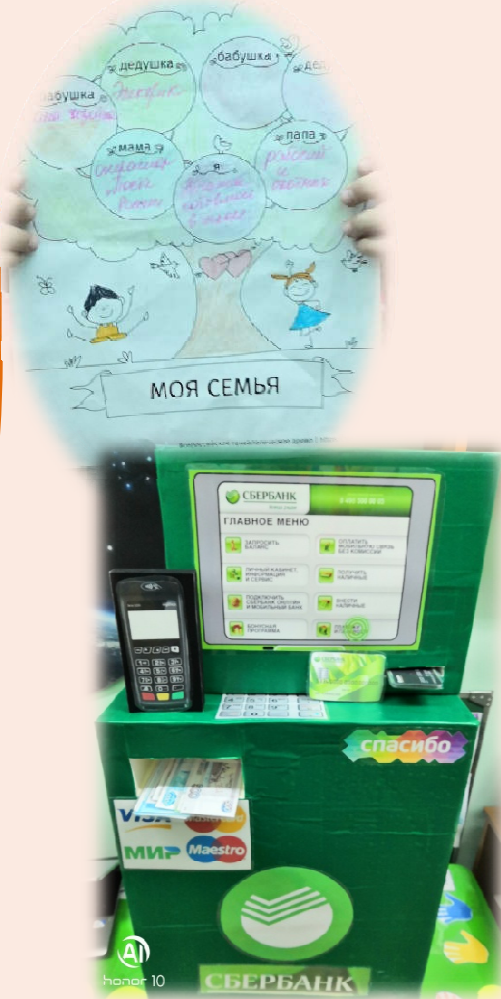
Рис. 1 ГЕНЕОЛОГИЧЕСКОЕ ДРЕВО «Профессии нашей семьи»